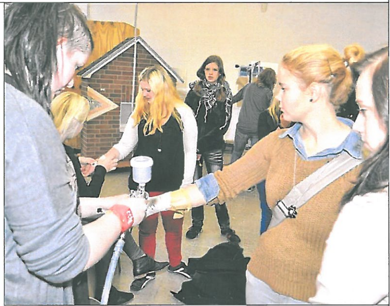
Über 130 Ausbildungsberufe werden auf der Berufsinformationsbörse vertreten sein.

Die BIB Emsland ist eine Initiative des Landkreises Emsland und findet in Kooperation mit den Partnern der dualen Ausbildung sowie der Agentur für Arbeit Nordhorn statt. Weitere Informationen sind beim Landkreis Emsland, Ansprechpartner Björn Hoefmann, unter der Telefonnummer 0 59 31 / 44 13 64 und der E-Mail-Adresse bildung@emsland.de erhältlich sowie zusätzlich auf der Webseite www.bib-emsland.de .