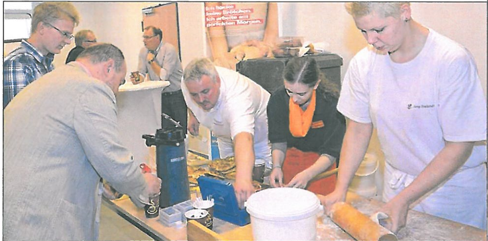
An den Berufsbildenden Schulen in Meppen findet die Berufsinformationsbörse am 9. Oktober in der Zeit von 8 bis 15 Uhr statt.

Vom Anfang bis zum Schluss, das Lesemuss!