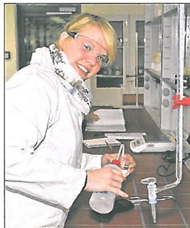
Arbeiten mit chemischen Stoffen erfordert Vorsicht.