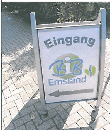
Schilder weisen den Weg zum Veranstaltungsort.